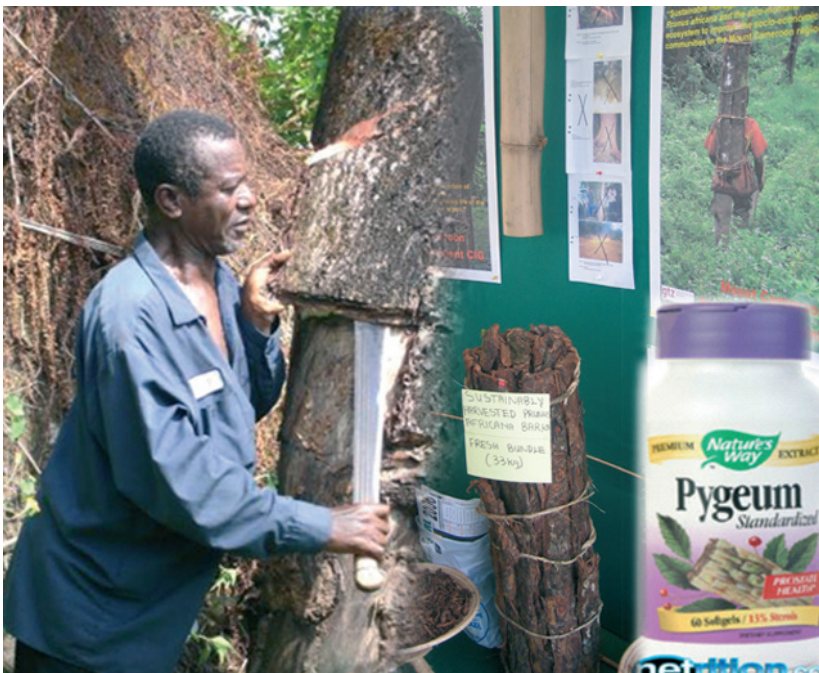
Récolte de Prunus africana en vue de la fabrication des médicaments pour soigner l'hypertrophie bénigne de la prostate

5.2 Chaque Etat prend toutes les mesures nécessaires pour la redistribution de la rente issue de l'exploitation des PFNL aux populations riveraines des forêts.