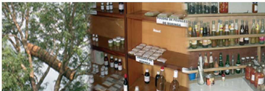
Production, transformation et vente des PFNL