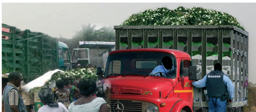
Contrôle de routine

18.2 Il prévoit également des mesures incitatives de la découverte et de la répression des infractions.