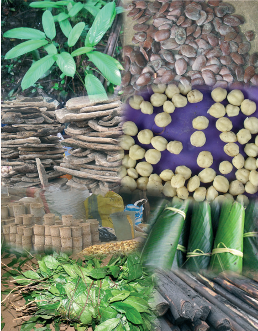
Produits forestiers non ligneux

ou fruits et produits de la forêt naturelle, productos forestales non maderables, productos forestiers autres que le bois, PFNL et produits forestiers accessoires.