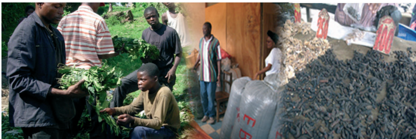
Commercialisation de Gnetum spp., de la mangue sauvage et des chenilles

13.4 Dans l'espace communautaire COMIFAC, les PFNL circulent conformément aux dispositions de l'Accord sous-régional sur le contrôle forestier en Afrique Centrale.