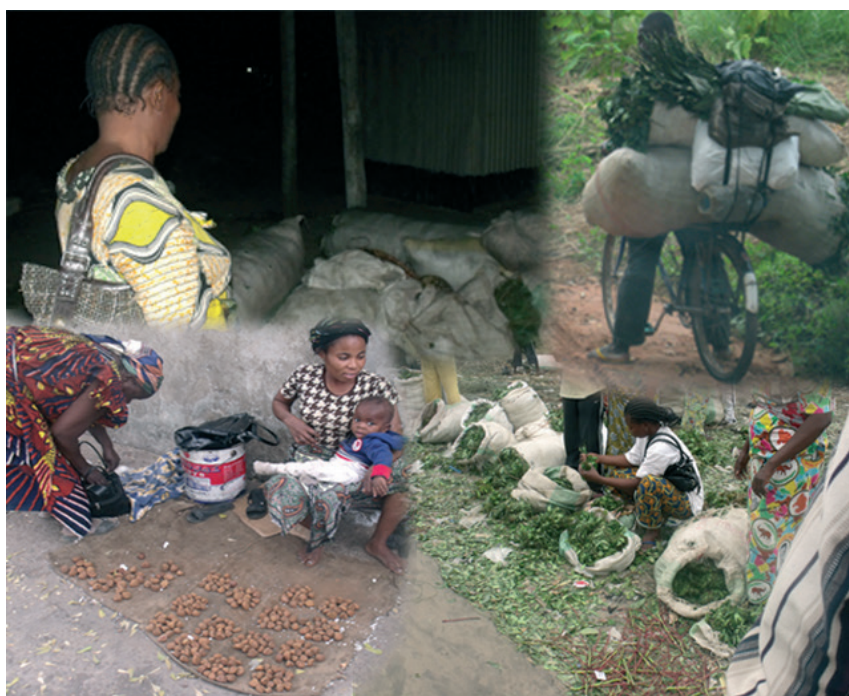
Des acteurs dans l'exploitation et la commercialisation des PFNL

Mesures spécifiques de référence pour la gestion durable des PFNL adaptables au contexte de chaque Etat, les présentes Directives constituent par ailleurs une contribution à la mise en œuvre du Plan de Convergence. L'objectif visé est que chaque pays de la COMIFAC dispose d'un cadre politique, légal, fiscal et institutionnel approprié favorisant la contribution significative des PFNL à la sécurité alimentaire et la pleine réalisation du droit à l'alimentation, au développement socio-économique, à la conservation et à l'utilisation durable de la biodiversité et à la gestion durable des forêts de la sous-région d'Afrique centrale.